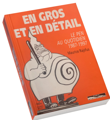
En gros et en détail Le Pen au quotidien 1987 - 1997